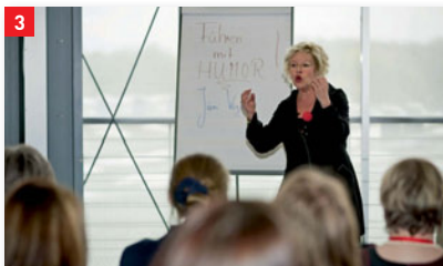
Eine Vielzahl von Workshops laden in den diversen Veranstaltungsräumen zur Teilnahme ein.

Das Angebot verschiedener Messerundgänge in den Ausstellungshallen ergänzt den Kongress WoMenPower 2012.