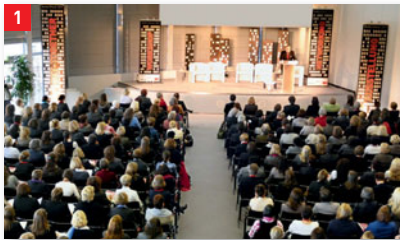
Eröffnung und Podiumsdiskussion finden vormittags im Saal 1 statt.