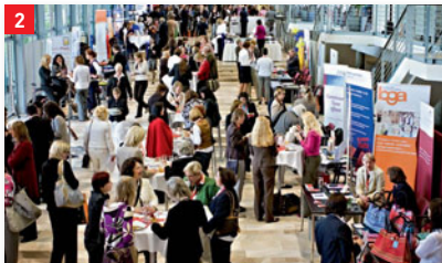
Im Foyer des Convention Centers präsentieren sich zahlreiche Unternehmen, Verbände und Organisationen in der kongressbegleitenden Ausstellung.