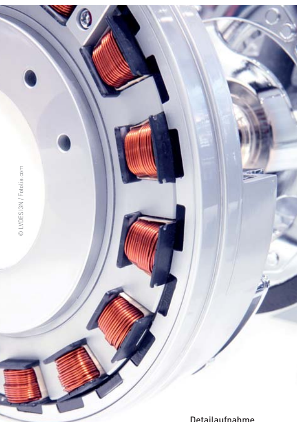
Detailaufnahme eines Hybrid-Elektromotors.