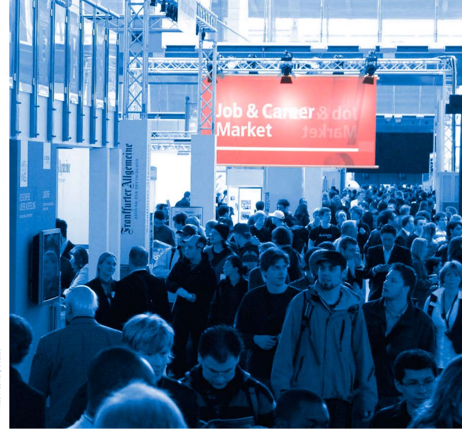
Printed in Germany 04/2010