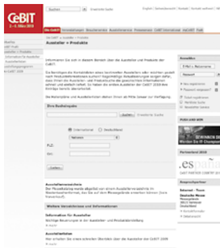
Den Gang durch die Hallen online vorbereiten: Die Aussteller- und Produktsuche der CeBIT hilft dabei.

➔ Sie wollen Ihren Messebesuch optimal vorbereiten und vor Ort in Hannover keine Zeit verlieren? Das ganzjährig erreichbare CeBIT-Portal der Deutschen Messe AG hilft Ihnen dabei. Seit Ende Januar 2010 finden Sie unter www.cebit.de/ausstellerprodukte ausführliche Informationen zu den einzelnen Ausstellern und ihren Angeboten. Überdies helfen Ihnen Hallenpläne und Ausstellerlisten dabei, Ihre Messetermine zu planen und keinen für Sie relevanten Anbieter zu übersehen. Regelmäßige Aktualisierungen sorgen dafür, dass Ihnen die Aussteller- und Produktsuche die gewünschten Informationen schnell und einfach liefert.