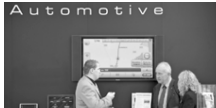
Treffpunkt für Automotive-Profis: Der Navigation Day am 5. März vernetzt Fachleute.

➔ Nach Jahren des Booms ist der Markt für Navigationsgeräte und -lösungen unter Druck – durch sinkende Margen und Konkurrenz in Form von Kostenlos-Angeboten. Lösungen, Strategien und Geschäftsmodelle sind deshalb der Schwerpunkt des Forums „CeBIT in Motion“, das auch 2010 wieder als wesentlicher Bestandteil des Ausstellungsbereichs „Destination ITS“ stattfindet. Hier stellen sich die Bereiche Telematik und Navigation, Automotive Solutions sowie Transport & Logistics dar. Das Forum befindet sich auf der Empore im östlichen Bereich der Halle 7 direkt über dem Ausstellungsbereich. Neben Fachvorträgen werden im Forum vor allem