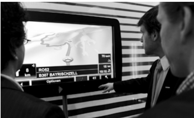
Navigations-Hilfen: Das Forum „CeBIT in Motion“ bietet Fachvorträge und Informationen rund um die Themen Telematik und Navigation.

erhalten Gelegenheit dazu am „Navigation Day“, der am 5. März stattfindet. Diese zum dritten Mal veranstaltete Konferenz ist ein Muss für Spezialisten aus dem Navigations-Markt. Alle Informationen zum Veranstaltungsprogramm und zu den Kosten der Teilnahme gibt es unter www.cebit.de/77193 .