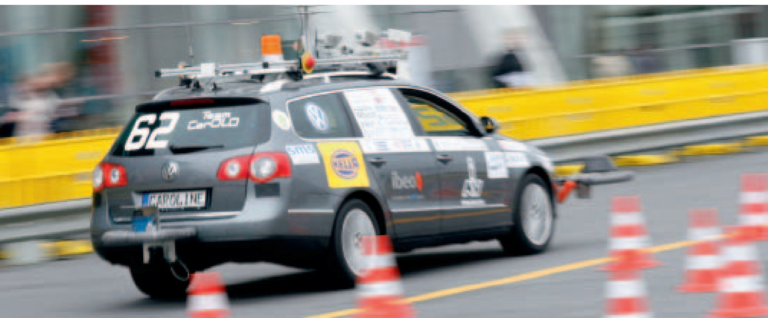
Livedemonstration von Fahrerassistenzsystemen / Live presentation of advanced driver assistance systems