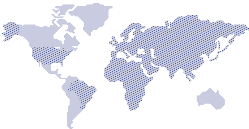
Die Fokustländer der Global Business & Markets 2011

Die Nachfrage aus Schwellenregionen wie Asien und Afrika schafft auch für kleine und mittlere Unternehmen neue Chancen beim Einstieg in internationale Märkte.