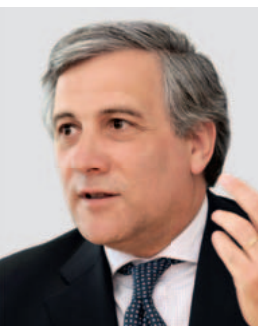
David McAllister Ministerpräsident des Landes Niedersachsen

Den Netzwerken und Partnern aus der ganzen Welt, die diese einzigartige internationale Außenwirtschaftsveranstaltung in der niedersächsischen Landeshauptstadt auch 2011 unterstützen, gilt mein persönlicher Dank.