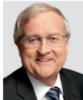
Rainer Brüderle Bundesminister für Wirtschaft und Technologie