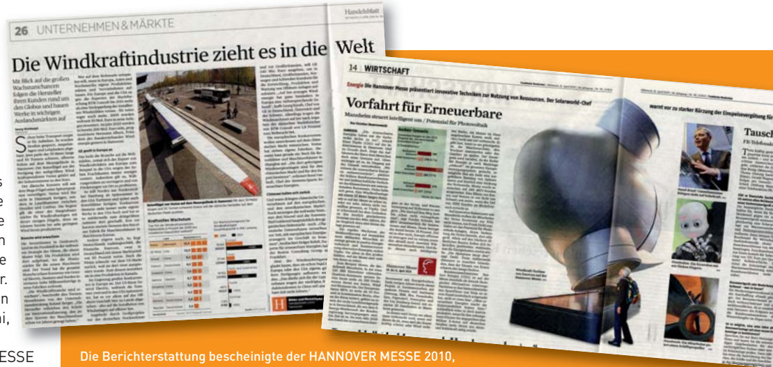
Die Berichterstattung bescheinigte der HANNOVER MESSE 2010, insbesondere den Energiethemen, durchweg großes Potenzial. Die Presse sprach einhellig von einer Zuversicht, die sich in der Industrie breitmachte.

Dominierte im Vorfeld der HANNOVER MESSE 2010 noch die Berichterstattung über die lähmende Aschewolke, änderte sich dies bereits am ersten Messetag. Denn kaum hat die Kanzlerin Deutschland erreicht, besucht sie die HANNOVER MESSE für einen ausführlichen Rundgang. Am Dienstag berichtete die FAZ unter dem Titel: „Faszination in Grün und Blau. Die HANNOVER MESSE ist das Schaufenster der Industrie. Ging es früher um Automation und Rationalisierung, stehen heute Klimaschutz und Ressourcenschonung im Zentrum.“ Am Mittwoch standen die Energiethemen im Fokus der