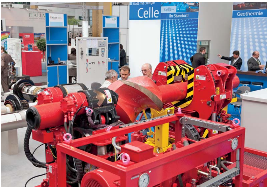
Auf dem Gemeinschaftsstand „Geothermie Celle“ präsentierte sich die Wirtschaftsförderung der Stadtverwaltung gemeinsam mit zehn Unternehmen der Region, die Innovationen aus dem Erdwärmebereich vorstellten.