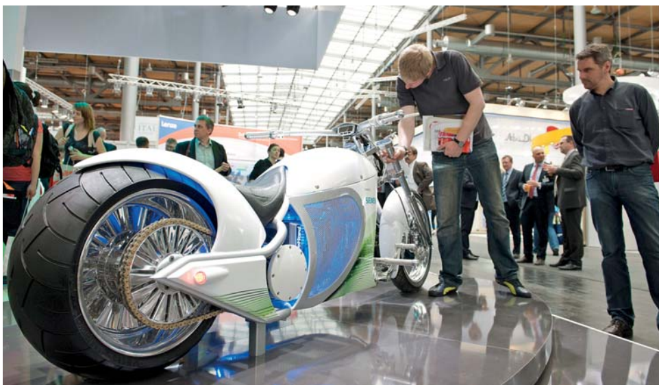
Das Siemens-Bike wird durch einen Elektromotor angetrieben. Ein Ladevorgang reicht für eine Strecke von rund 80 Kilometern.

Die Branche der Erneuerbaren Energien wird eine der deutschen Schlüsselindustrien, erwarten Experten. Bis 2020 würden allein in Deutschland 235 Milliarden Euro in Erneuerbare-Energien-Anlagen investiert. Vor allem weltweit würden die Erneuerbaren Energien aber massiv ausgebaut. Umso wichtiger sei die ganzheitliche Betrachtung dieser technologischen Herausforderung. Dazu zähle das internationale Zusammenwirken der Unternehmen ebenso wie die thematische Aufbereitung aller Aspekte in Foren und Diskussionsrunden sowie die gebündelte Betrachtung aller technologischen Möglichkeiten. Dass die MobiliTec dies zu leisten vermag, hat sie bereits bei ihrer Premiere gezeigt.