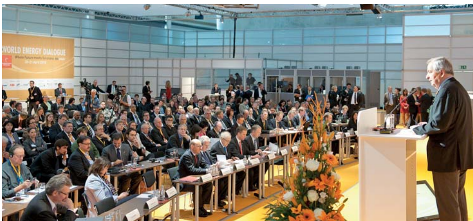
Der WORLD ENERGY DIALOGUE stand unter der Leitung von WED-Chairman Prof. Dr. Dr. h. c. Klaus Töpfer (am Rednerpult). Schirmherr des WED war der deutsche Bundesminister für Wirtschaft und Technologie, Rainer Brüderle. Organisiert wurde der WED durch den Bundesverband der Deutschen Industrie (BDI), die Deutsche Energie-Agentur (dena) und die Deutsche Messe AG.