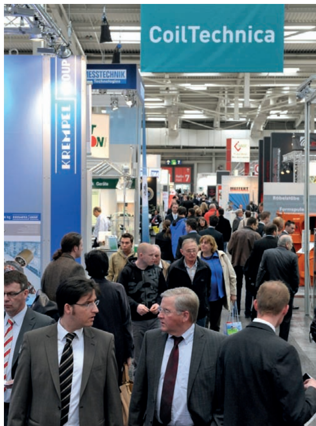
Volle Gänge auf der ersten CoilTechnica – die Aussteller zeigten sich beeindruckt von der Qualität der Messebesucher.

verlauf sehr zufrieden, und viele werden im nächsten Jahr erneut in Hannover ausstellen.“ Die CoilTechnica wird sich 2011 nach dem