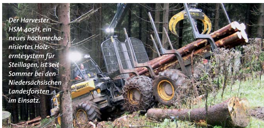
Der Harvester HSM 405H, ein neues hochmechanisiertes Holz-erntesystem für Steillagen, ist seit Sommer bei den Niedersächsischen Landesforsten im Einsatz.

Das Leitmotiv der LIGNA HANNOVER 2009 – „Making more out of wood – Technologie für Ressourceneffizienz“ bedeutet für die Forstwirtschaft: „Rohstoffe und Technik effizient nutzen“. Dabei spielt die Holzmobilisierung eine große Rolle. Gemeint sind die organisatorischen, beratenden und logistischen Aktivitäten, die den Umfang der Holzernte erhöhen sollen. Etliche Aussteller zeigen auf der LIGNA HANNOVER Beratungs- und Betreuungssysteme, die sich von der flächendeckenden Waldinventur über die Begründung und Pflege von Kultu-