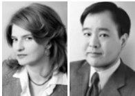
Natalya Kaspersky CEO InfoWatch, Chairperson of Board of Directors of Kaspersky Lab