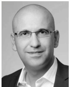
Mousse T. Music Producer & Artist mousse-t.com