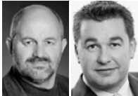
Dr. Werner Vogels Vice President Worldwide Architecture, Chief Technology Officer, amazon.com