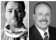
Stewart Butterfield Co-Founder, Flickr.com