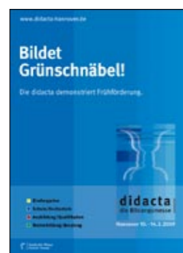
Zielgruppenspezifische Anzeigen 1/1 Seiten 4c