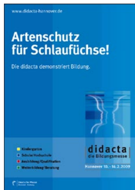
Allgemeine Anzeige 1/1 Seite 4c

Wer, wie, was – wieso, weshalb, warum: Mit einer aufmerksamkeitsstarken Werbekampagne informiert die didacta auf allen Kanälen über den wichtigsten Bildungsevent 2009. Zielgruppenspezifische Anzeigen und Banner kommunizieren deutschlandweit eine Aussage: Der Besuch der didacta ist ein absolutes Muss für alle Bildungsinteressierten.