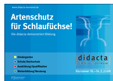
Allgemeine Anzeige 1/2 Seite quer 4c