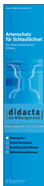
Allgemeine Anzeige 1/3 Seite hoch 4c