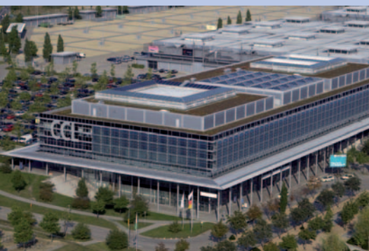
Congress Centrum Leipzig

Frühjahrstagung IGBref CTIF Delegiertenversammlung