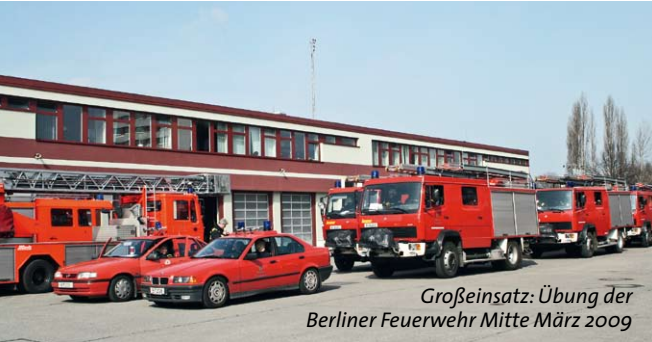
Großeinsatz: Übung der Berliner Feuerwehr Mitte März 2009

und Hilfsorganisationen stehen weltweit vor einer Neuausrichtung ihrer komplexen Aufgaben. Neue Technologien, neue Einsatzmethoden, effiziente Systemvernetzung, länderübergreifende Kooperationen, so wird die INTERSCHUTZ 2010 zeigen, können die Arbeit erleichtern.