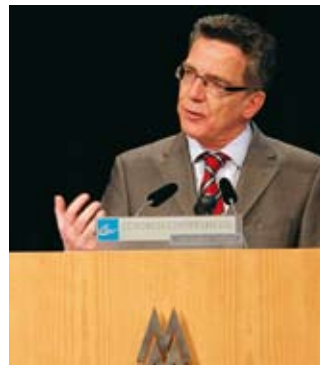
Bundesinnenminister Thomas de Maizière bei seinem Grußwort an die Delegierten des CTIF-Kongresses

Zuvor hatte Bundesinnenminister Thomas de Maizière in seinem Grußwort an die Ver-