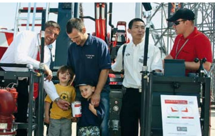
Einmal in die Luft gehen – für Jung und Alt ein tolles Erlebnis

Schauen, staunen, erleben – die INTERSCHUTZ 2010 vermittelte für Aussteller und Besucher ein Messe-Ereignis mit vielen bleibenden Erinnerungen an menschliche Begegnungen, faszinierende technologische Entwicklungen und spannende Aktionen. Die Fotos auf diesen Seiten vermitteln einige Impressionen von unvergesslichen Messtagen.