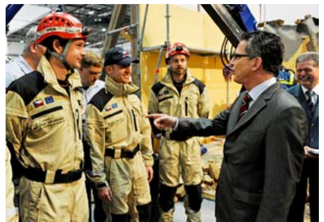
Bundesinnenminister Thomas de Maizière bei seinem Messerundgang (rechtes Foto)