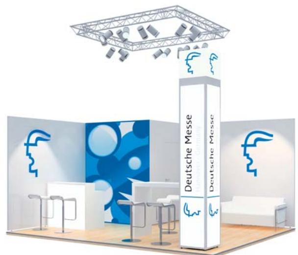
Gestaltungsbeispiel mit Zusatzausstattung / Typical stand configuration with additional fittings