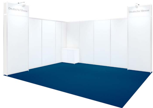
Basisausstattung / Basic fittings