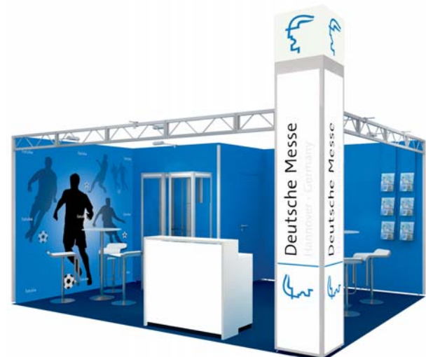
Gestaltungsbeispiel mit Zusatzausstattung / Typical stand configuration with additional fittings