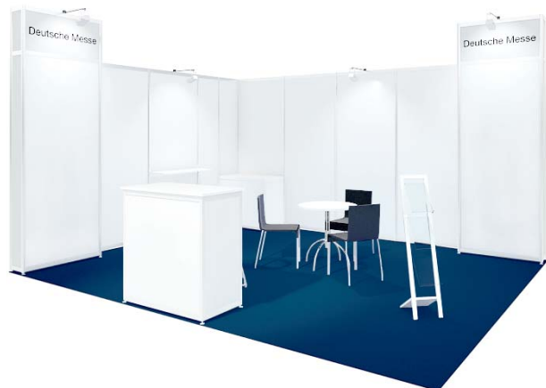
Gestaltungsbeispiel mit Zusatzausstattung / Typical stand configuration with additional fittings