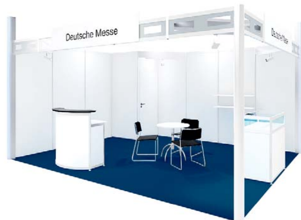
Gestaltungsbeispiel mit Zusatzausstattung / Typical stand configuration with additional fittings