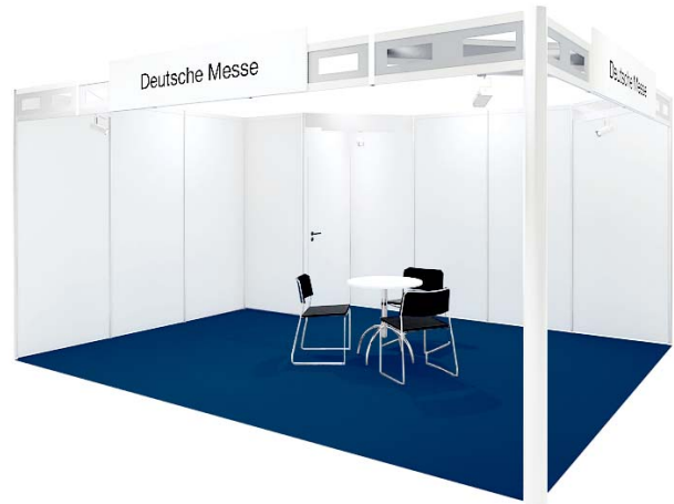
Basisausstattung / Basic fittings