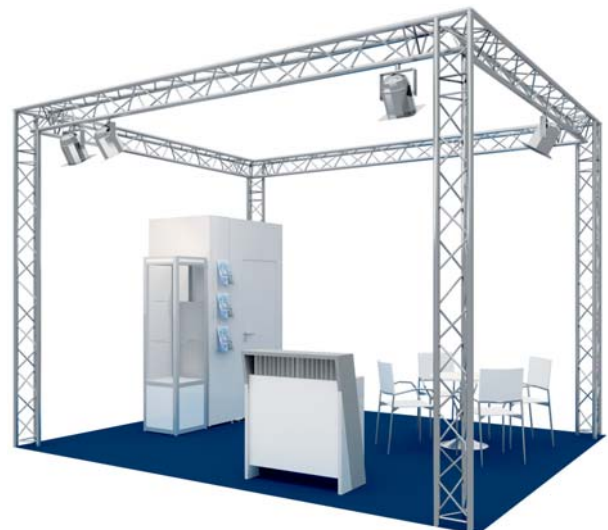
Gestaltungsbeispiel mit Zusatzausstattung / Typical stand configuration with additional fittings

Weitere Informationen über: Further information is available from: