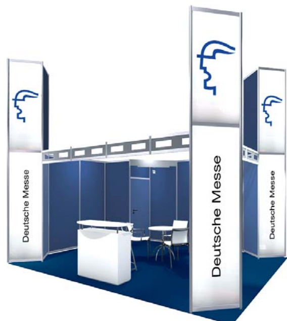
Gestaltungsbeispiel mit Zusatzausstattung / Typical stand configuration with additional fittings