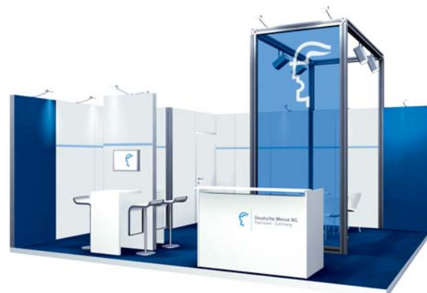
Gestaltungsbeispiel mit Zusatzausstattung / Typical stand configuration with additional fittings