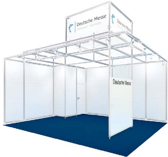
Basisausstattung / Basic fittings