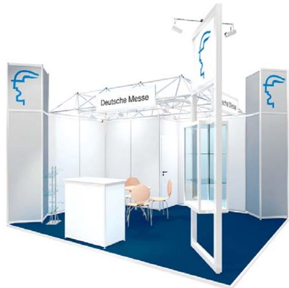
Gestaltungsbeispiel mit Zusatzausstattung / Typical stand configuration with additional fittings