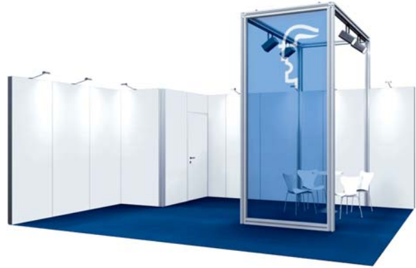
Basisausstattung / Basic fittings

* You can select alternative furniture on request up to four weeks before opening day of the event.