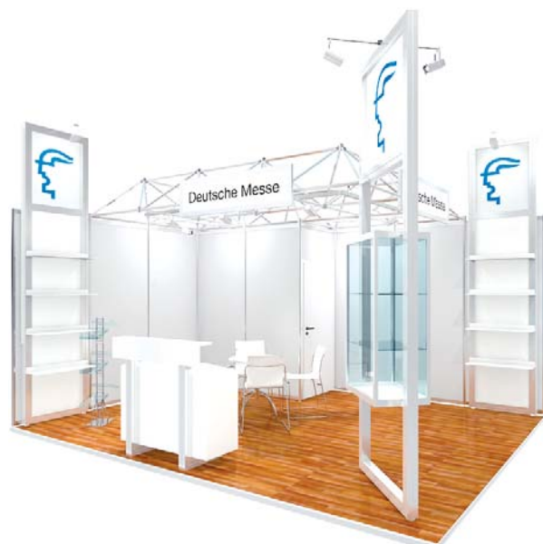
Gestaltungsbeispiel mit Zusatzausstattung / Typical stand configuration with additional fittings