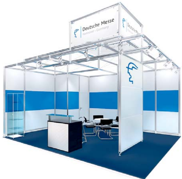
Gestaltungsbeispiel mit Zusatzausstattung / Typical stand configuration with additional fittings