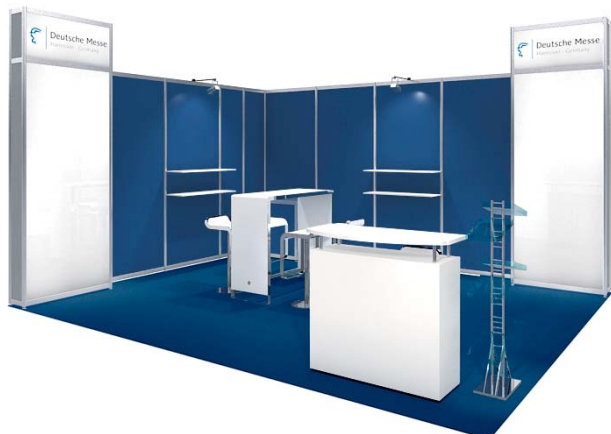
Gestaltungsbeispiel mit Zusatzausstattung / Typical stand configuration with additional fittings