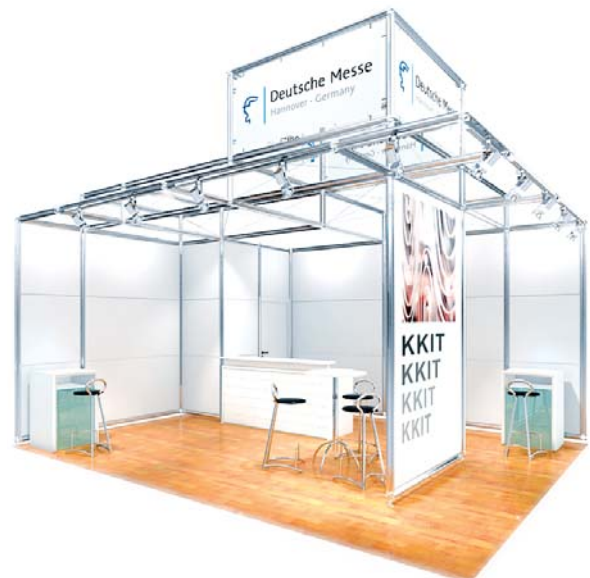
Gestaltungsbeispiel mit Zusatzausstattung / Typical stand configuration with additional fittings