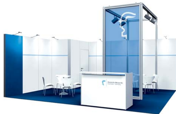
Gestaltungsbeispiel mit Zusatzausstattung / Typical stand configuration with additional fittings