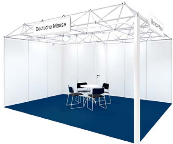
Basisausstattung / Basic fittings

* You can select alternative furniture on request up to four weeks before opening day of the event.