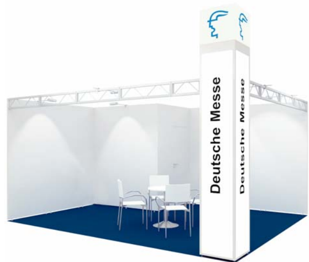
Basisausstattung / Basic fittings

* You can select alternative furniture on request up to four weeks before opening day of the event.