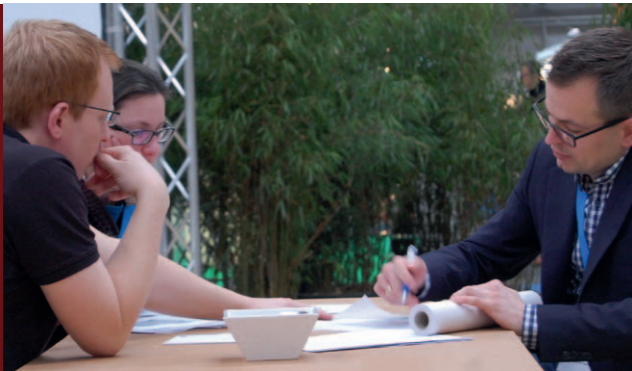
WAS KÖNNEN WIR FÜR SIE TUN? BERATUNG UND MEHR AUF DEM PLANERDECK