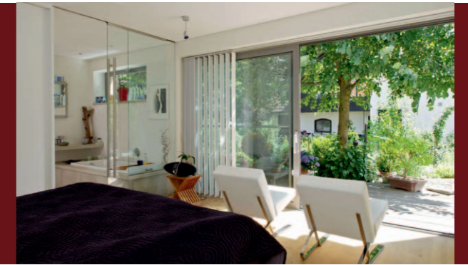
LICHT, FARBE, FORM INNENARCHITEKTEN SCHAFFEN RAUM ZUM LEBEN