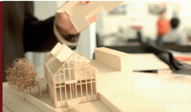
VOM TRAUM ZUM HAUS DAFÜR SIND ARCHITEKTEN DIE RICHTIGEN PARTNER