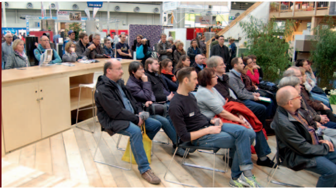
VORTRÄGE UND BERATUNG EXPERTENWISSEN AUS ERSTER HAND