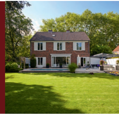
GRÜNE OASEN MIT LANDSCHAFTSARCHITEKTEN FREIRÄUME GESTALTEN