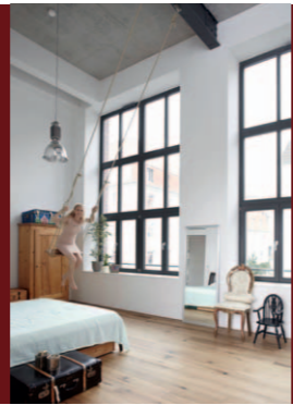
NEUBAU, UMBAU ODER SANIERUNG MIT ARCHITEKTEN EFFEKTIV PLANEN