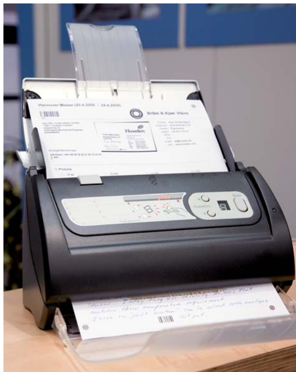
3. Einscannen des ausgefüllten Fragebogens