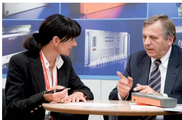
2. Ausfüllen des Fragebogens, der mit dem System erstellt werden kann

Alle Paketangebote sind erweiterbar, wir beraten Sie gerne!