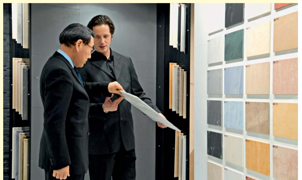
Anschauliche Produktmuster bieten den Fachbesuchern ein optisches und haptisches Erlebnis.

Hannover, 16.-19.1.2010 Angebot präsentieren. Dabei werden sich an der fliesen/tiles vorrangig Firmen aus dem mittleren und gehobenen Qualitätssegment beteiligen, die ihre Marktposition im Objektgeschäft konsequent ausbauen oder sich dem Objektthema stärker zuwenden wollen. Um den Architekten und Innenarchitekten den Besuch dieser Ausstellerguppe zu ermöglichen, wird fliesen/tiles räumlich mit der contractworld in der Halle 4 zusammengeführt werden. Weitere Informationen unter www.fliesentiles.com