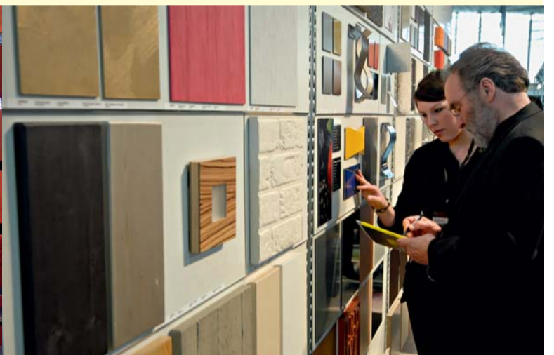
Hochwertige Material- und Produktpräsentationen informieren die Besucher.

In diesem Jahr trafen sich bereits zum 9. Mal Architekten und Innenarchitekten, um sich mit namhaften Herstellern objektgeeigneter Produkte und neuer Materialien auszutauschen. Wohin sich der Markt im Objektgeschäft entwickelt und welche Produkte in den Bereichen Office, Hotel und Shop zukünftig nachgefragt werden, kann niemand mit letztendlicher Sicherheit sagen. Wer jedoch im Januar als Aussteller oder Besucher auf der contractworld war, weiß, in welche Richtung die Trends gehen. Die contractworld, als internationales Forum für Architektur und Innenarchitektur bietet Unternehmen aus den Bereichen Möbel, Leuchten und Bodenbeläge die erstklassige Gelegenheit, ihre Produkte, Konzepte und zukunftsorientierten Ideen im exklusiven Rahmen zu präsen-