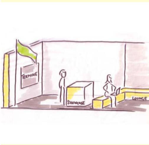
Showcases für jeden Aussteller

Welche Neuerungen im nächsten Jahr zu erwarten sind, haben wir an dieser Stelle zusammengefasst: Ein kleiner Vorgeschmack auf das, worauf Sie sich schon jetzt freuen können und was Sie im Januar 2010 auf keinen Fall verpassen sollten.