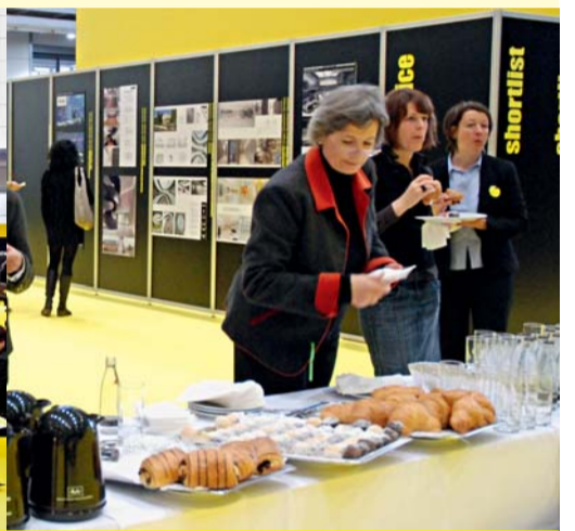
Kontakte knüpfen bei Snacks und Getränken

Übersichtlichkeit steht an erster Stelle bei der Präsentation der Produkte. Jedem Aussteller wird in der contractworld-Stadt ein Showcase zur Verfügung gestellt, in dem er sein neuestes, innovativstes und architekturelevantestes Produkt platzieren kann. Diese Standardisierung ermöglicht dem Besucher einen schnellen Überblick. Über ein Publikums-Voting erhalten die Unternehmen nicht nur Feedback, sondern auch einen neuen Pool an Architekten-Adressen. Viele Kontakte in kurzer Zeit können Aussteller wie Architekten in sogenannten Speed-Workshops knüpfen, die mehrmals am Tag stattfinden. Ziel ist dort, in einem moderierten Verfahren über Produkte und Materialien zu sprechen, wodurch sich der Architekt über seine Mög-