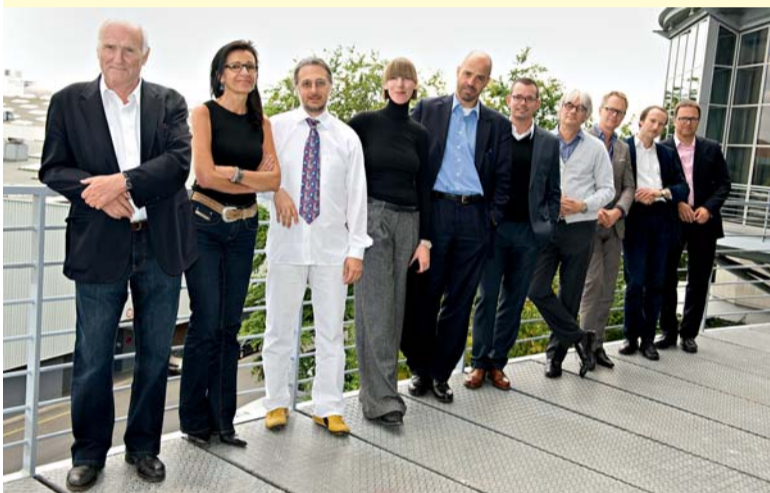
Gut gemischt und kompetent: Die Jury 2010

und der neuen Awardkategorie Education/Bildung/Healthcare prämiert. Die Preisträger der „New Generation“ (Architekten unter 40) werden bei der öffentlichen Jurysitzung auf der contractworld im Januar 2010 gekürt.