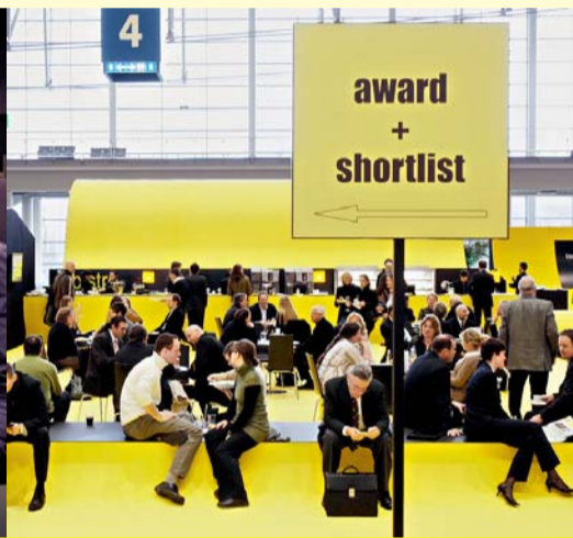
Neu gewonnene Eindrücke mit Kollegen diskutieren