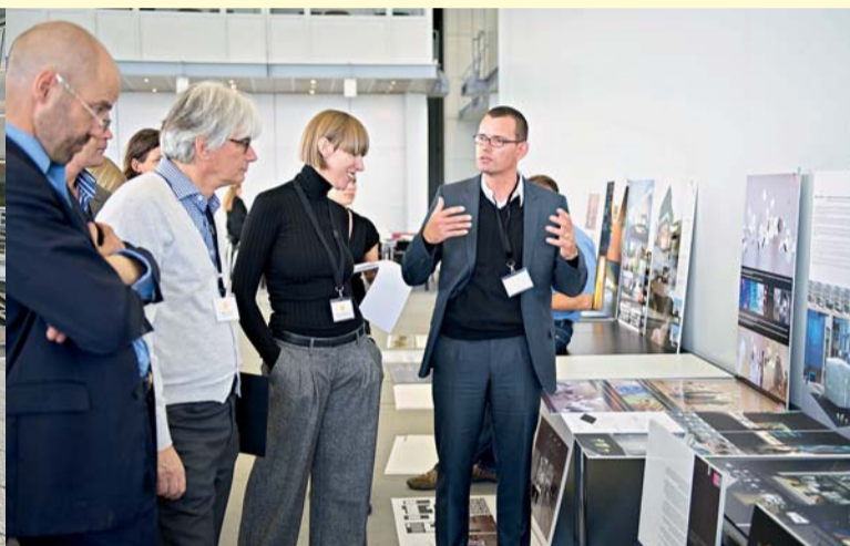
Bei der Suche nach den Siegern 2010 wurde viel diskutiert.