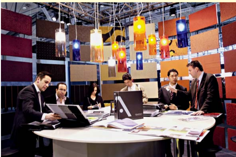
Auf der cw.exhibition knüpfen Architekten und Unternehmensvertreter Kontakte.

world.exhibition, auf der nicht nur richtungsweisende Innovationen und aktuelle Trends diskutiert, sondern auch vielversprechende Kontakte zwischen Fachbesuchern und Ausstellern geknüpft werden.